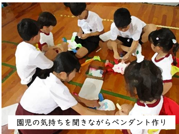
園児の気持ちを聞きながらペンダント作り