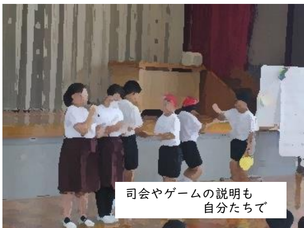
司会やゲームの説明も自分たちで

9月15日(金)に、太陽保育園・服部幼稚園・三須幼稚園の3園から約40名の5才児を招き、東小の体育館で「よろしくの会」を行い、5年生と園児たちが交流しました。お互いに緊張していた子どもたちも、じゃんけんゲームやペンダント作りを通して、和やかに交流することができました。5年生の優しい声かけと笑顔が、とても印象的でした。11月には、今度は各園を5年生が訪問して、交流する予定です。