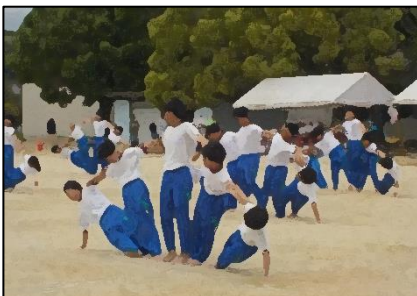
みんなで心を一つにし、笑があふれた組体操