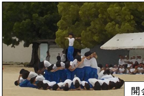
開会式でのスローガン発表