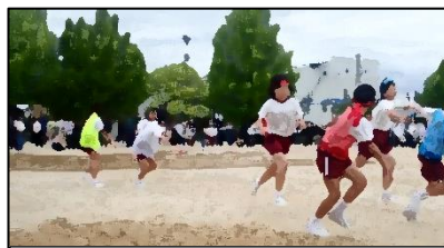
みんなの思いをつないだリレー