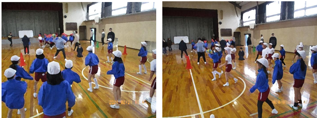
学年活動（ドッジボール）の様子

先日の学年活動・授業参観・学級懇談では、お世話になりました。保護者の皆様には、いつも温かいご支援ご協力をいただき、感謝しております。残り少なくなった日々を大切に、有意義に過ごし、1年間の学習のまとめや生活のまとめをしながら、4年生への準備をしていきたいと思ひます。最後までよろしくお願ひいたします。